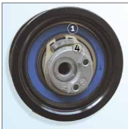
Slika 1: 531 0440 30

OE-br.: 038 109 243 038 109 243 D 038 109 243 F 038 109 243 G 038 109 243 H 038 109 243 N