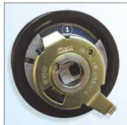
Slika 2: 531 0440 30