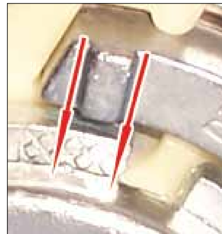
Slika 5: Oba ruba pokazivača su izvan izreza (strelice). Namještanje se mora korigirati!