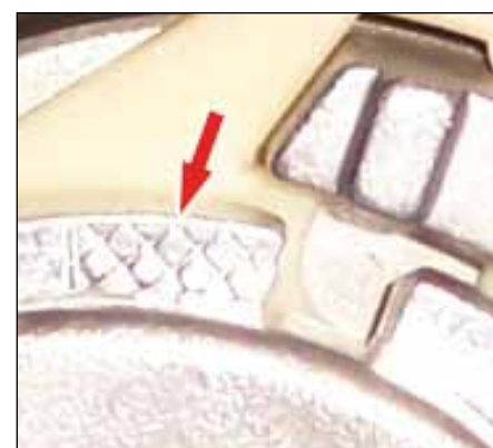
Slika 3: Križna gravura

Mjera istrošenosti je prikazana na križnoj gravuri kućišta natezača pored izreza za namještanje nominalnog položaja napetosti remena (vidi sliku 3 ).