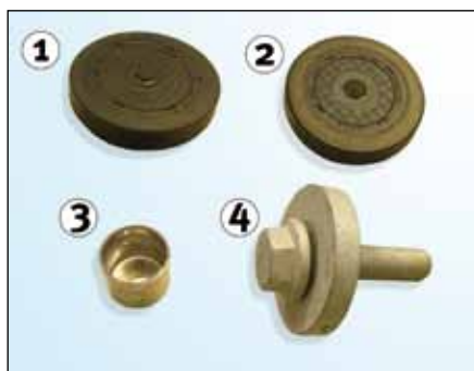
Slika 1: Opseg isporuke (pakiranja)

Kod zamjene gore navedenih setova (KIT i SET) kolotura za napinjanje neophodno je izvršiti također zamjenu pribora i opreme prikazane na slici 1 . U sklopu dodatne usluge Schaeffler Automotive Aftermarket nudi ove komponente u jednom pakiranju.