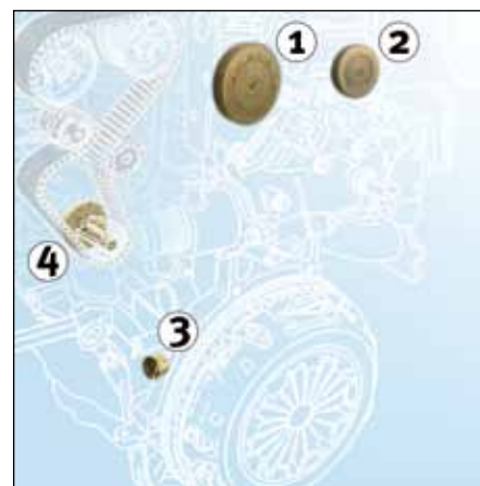
Slika 2: Montažna pozicija