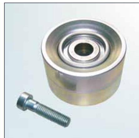
Slika 2: 532 0410 20 - nova izvedba

Zbog kontinuiranog razvoja tehničkog razvoja naših proizvoda izvršena je izmjena vodećeg kolotura, br. za narudžbu 532 0410 20.