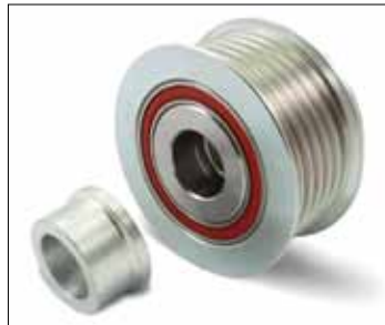
Slika 3: Stara (prethodna) izvedba

Kod nove izvedbe, unutarnji brtveni prsten na stražnjoj strani je proširen, tako da rastojni prsten koji je prikazan na Slici 3 više nije potreban.