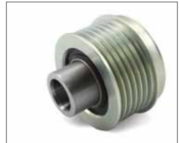
Slika 4: Nova izvedba

U prijelaznoj fazi se može dogoditi da će se isporučivati oba dvije izvedbe.