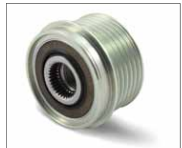
Slika 2: Nova izvedba

Kao dio našeg kontinuiranog tehničkog usavršavanja naših proizvoda, promjene su izvršene i na remenici slobodnog hoda alternatora (OAP) Kat.Br. 535 0233 10.